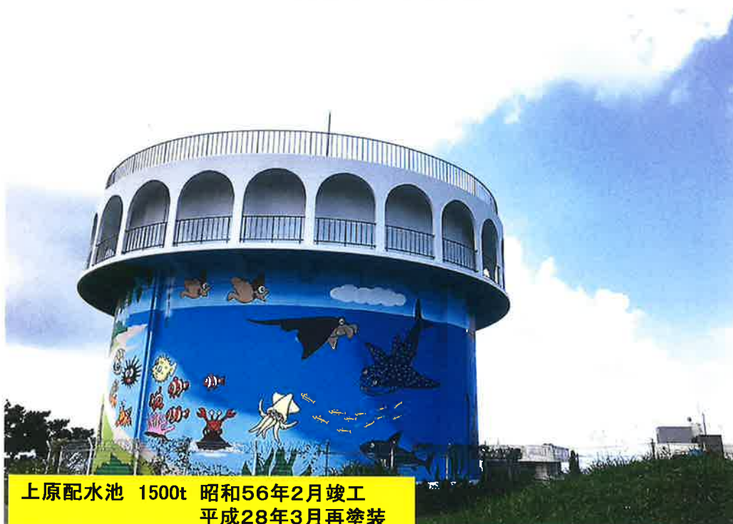
上原配水池 1500t 昭和56年2月竣工 平成28年3月再塗装